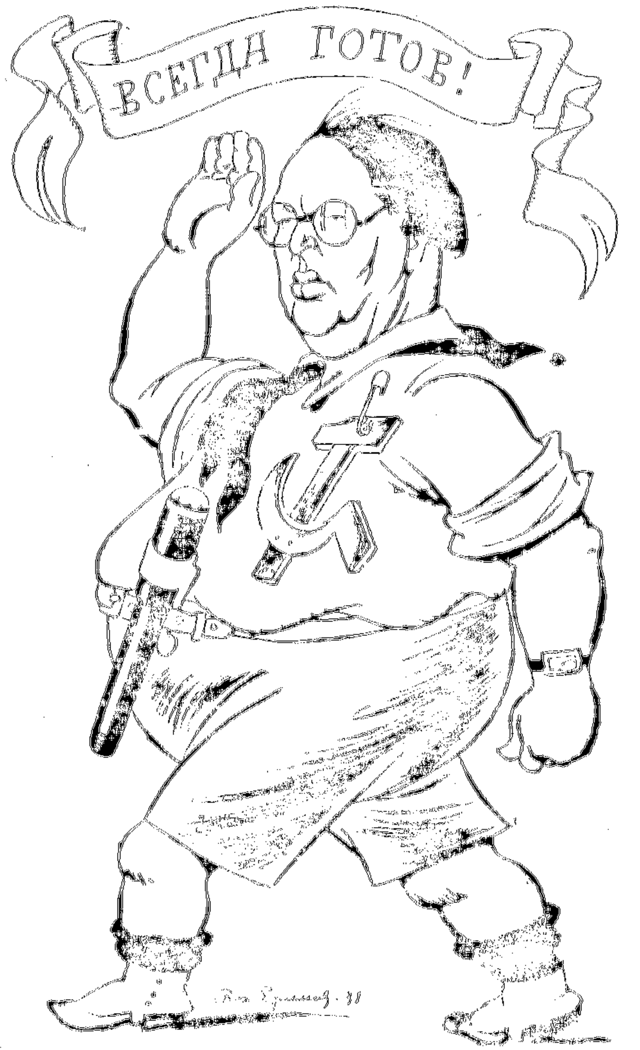
Дружеский шарж БОР. ЕФИМОВА