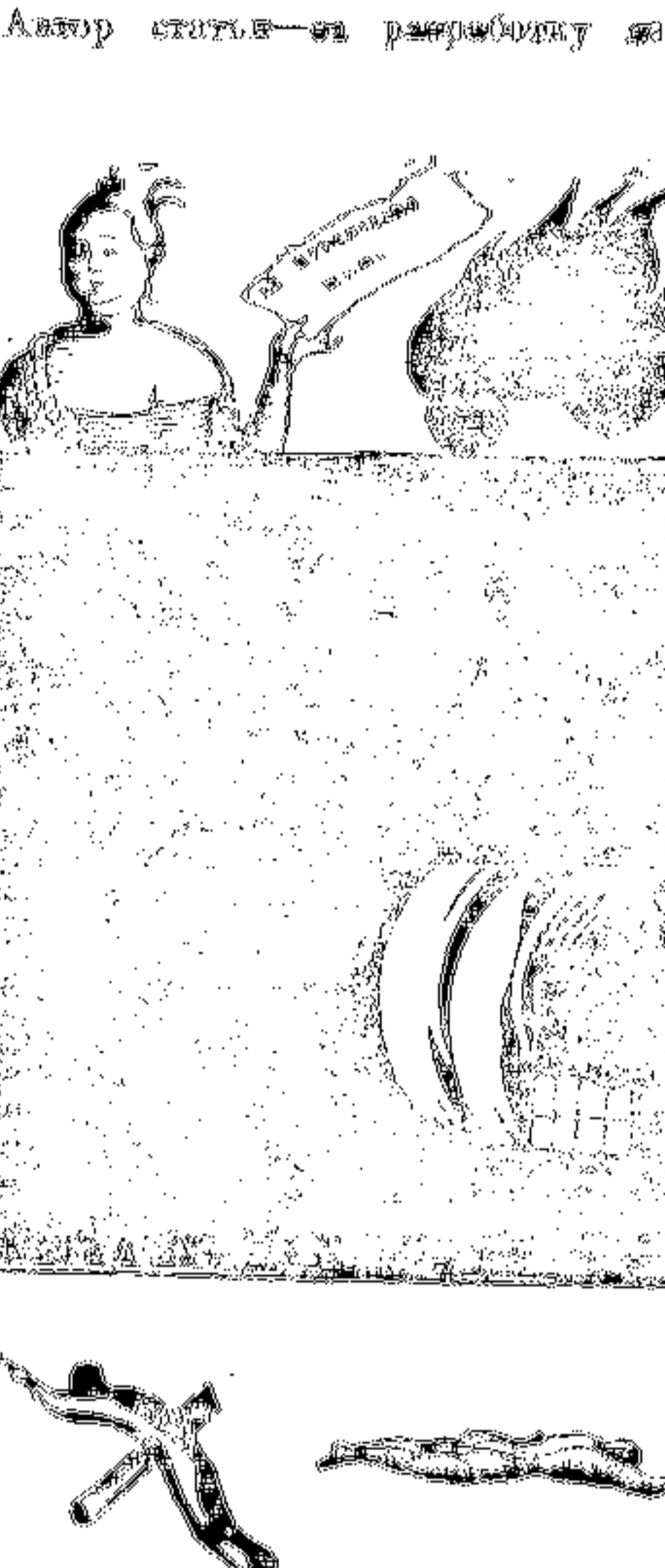
Иллюстрация к худ. Фавеллино...